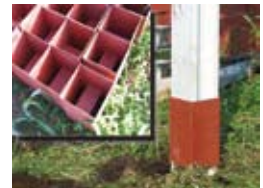
継ぎ手ジョイント