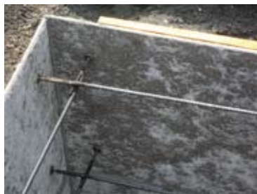
④コンクリート付着面加湿