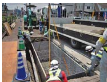
②KCスタンドフォーム据付け