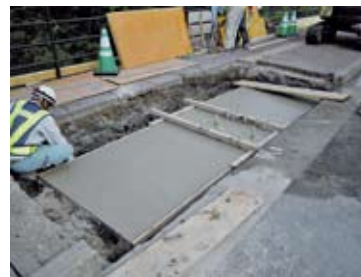
⑥所定高さまで打設。埋戻し・養生。