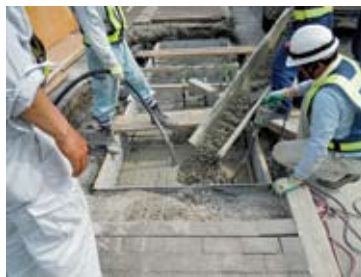
⑤生コン打設。周辺埋戻し。