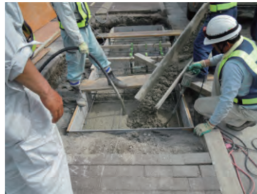
⑤生コン打設。周辺埋戻し。