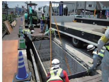
②KCスタンドフォーム据付け