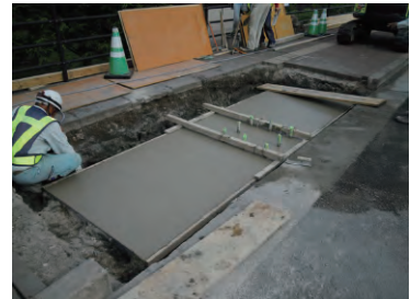
⑥所定高さまで打設。埋戻し・養生。