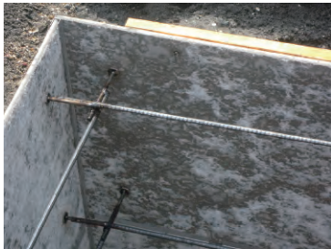
④コンクリート付着面加湿